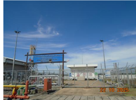
ภาพที่ 2-4 เจ้าหน้าที่รักษาความปลอดภัย บริเวณสถานีควบคุมความดันและวัดปริมาณก๊าซธรรมชาติ (MRS)