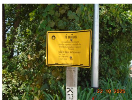
ภาพที่ 2-2 ป้ายแสดงตำแหน่งแนวท่อส่งก๊าซธรรมชาติ