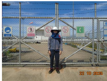
ภาพที่ 2-5 พนักงานสวมใส่อุปกรณ์คุ้มครองอันตรายส่วนบุคคล