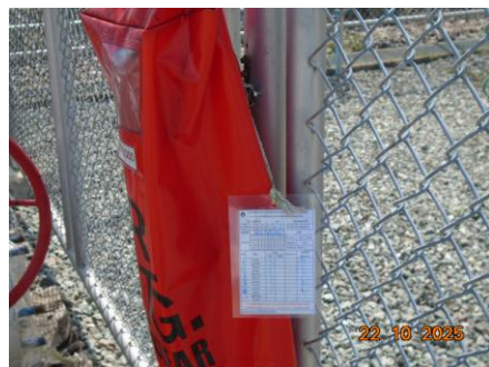
ภาพที่ 2-3 ถังดับเพลิงแบบเคมีผง และ Tag ตรวจสอบถังดับเพลิงแบบเคมีผง